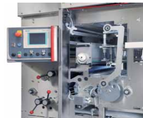
Stanzstation mit Wendedrucktassen