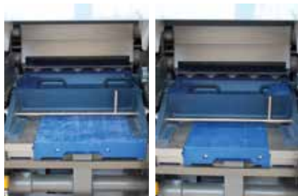
Пример перехода с 4-х рядного на 3-х рядный выход изделий

Благодаря простой смене нагнетающего поршня и перестановке рядности распределителя на головной машине Rex вы можете привести рядность в соответствие с габаритами противня.