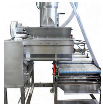
Leichte Zugänglichkeit durch ausziehbare Komponenten