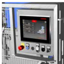
▲ Eine neue Oberfläche sorgt für noch einfachere Bedienung