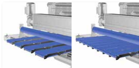
▲ Wechselbare Spreizbänder sorgen für maximale Flexibilität und große Produktvielfalt