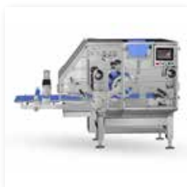
▲ Hohe Bodenfreiheit ermöglicht mühelose Reinigung