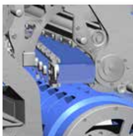
▲ Auswiegeleisten sind leicht zu wechseln